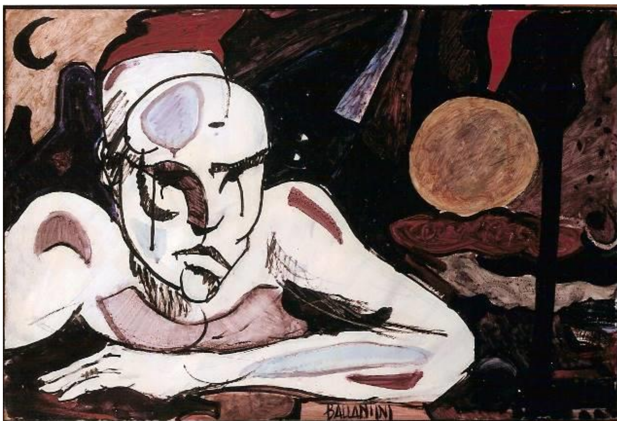
Dario Ballantini, Ricordo , 1989

XXXIII EDIZIONE Mostra Mercato Antiquariato Nazionale dal 19 al 27 ottobre 2019 a Villa Castelbarco – Vaprio d'Adda (MI)