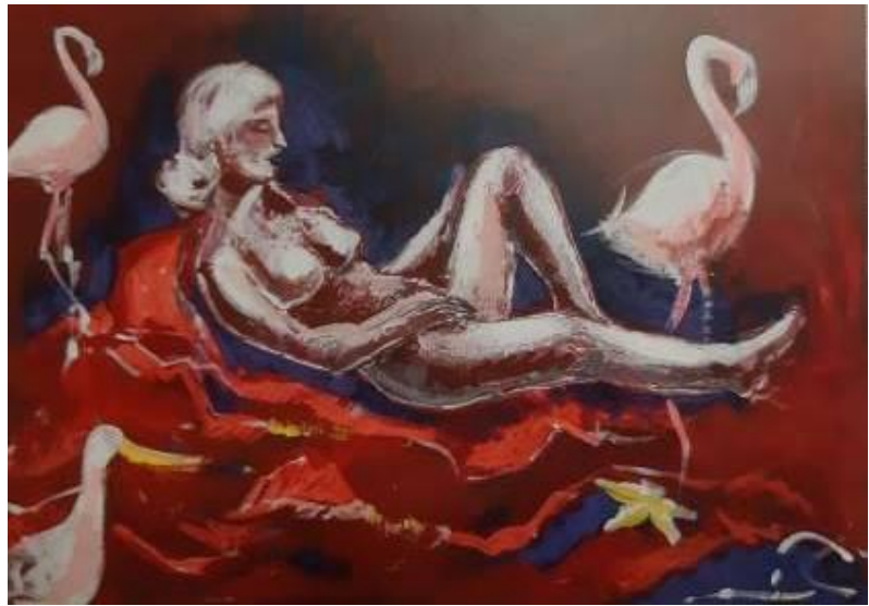
Dario Fo, La ragazza che veniva da di là dell'oceano , Olio su tela

Di Dario Fo si conosce l'opera teatrale, la capacità narrativa, il Mistero Buffo, il premio Nobel per la letteratura. Una carriera dedita al mondo della cultura e del teatro che ha messo in ombra quello che Dario Fo è sempre stato: un pittore . Dietro ad ogni stesura di un'opera teatrale e letteraria per Dario Fo vi erano prima di tutto un disegno e un quadro: intensi, vibranti, finalizzati alla rivelazione di un altro punto di vista, di una nascosta verità, o per dirlo con le sue parole: “In tutte le storie famose, come quella dei Borgia, si trovano sempre diverse versioni del dramma. Nella maggior parte dei casi, però, si scopre un intento deformante, soprattutto dal punto di vista storico. Personalmente non ho fatto altro che ricercare la verità”